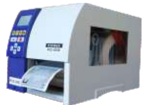
Thermotransferdrucker siehe ab Seite J1-A1